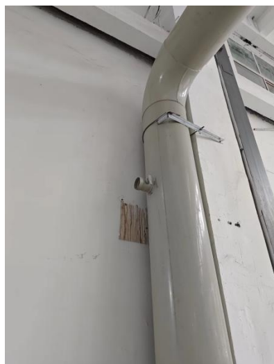
废气处理设施进口采样口