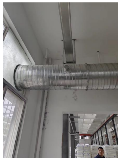
废气处理设施出口采样口